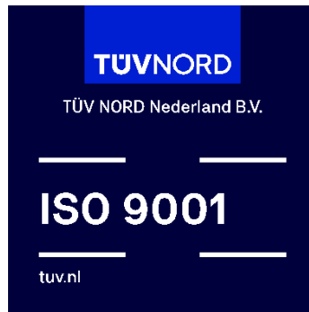
Voorbeeld van het TÜV NORD Nederland conformiteitsmerk